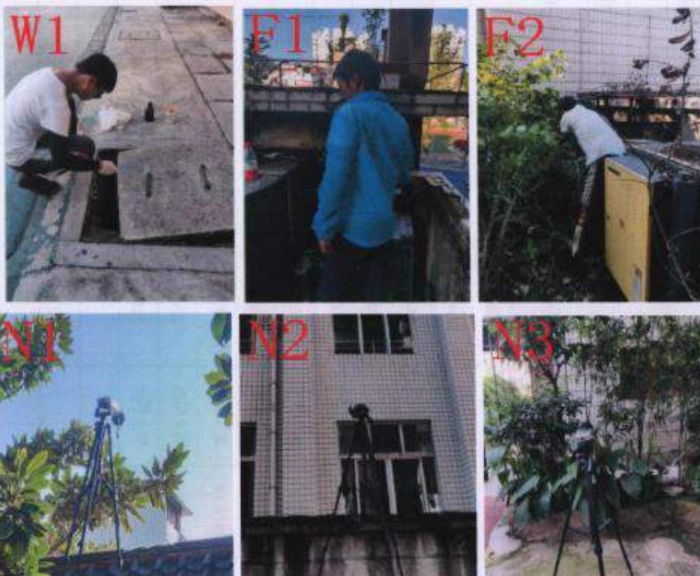
贵州中测检测技术有限公司