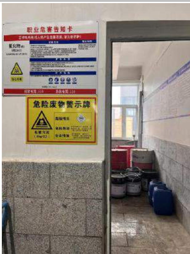
危废暂存间（电镀污泥）