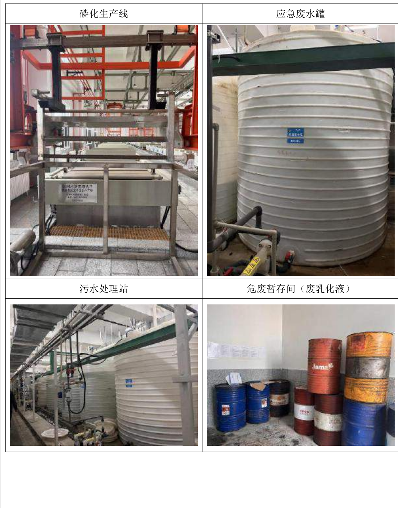
附图1、项目现场照片